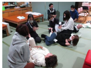
勉強会を行った際の の写真です。

3月14日(火)と22日(水)に、入所スタッフ向けに排泄についての勉強会を行いました。オムツメーカーのユニ・チャーム ケアアドバイザーによる、オムツの性能やそれを踏まえた正しい使用方法を説明して頂き、実際に職員間でオムツを装着し合いました。製造メーカーとしては試行錯誤の研究を重ね、いかに快適に、いかに漏れを減らせるよう考えられたものですが、私たち使う側が構造を十分に理解し性能を引き出す技術がないと、利用者には十分に還元されません。私たちにとっては普段から使い慣れているつमりのオムツですが、実際に話を聞くと意外と知らないことが多く、知識や技術の更新をしないといけないことに気付かされる勉強会となりました。ご家族には少しでもオムツ漏れによる洗濯物が減ることで実感してもらえらるよう頑張っていきたいと思ひます。