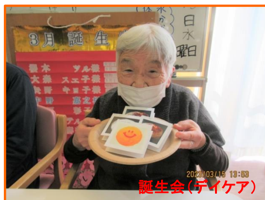
2023/03/15 13:53 誕生会(デイケア)

3月15日(水)の誕生会では、久しぶりにカラオケを行いました。マイクを持って気持ちよさそうに歌われる方、歌に合わせて手拍子をする方、一緒に口ずさむ方と、皆様思い思いに楽しまれていました。