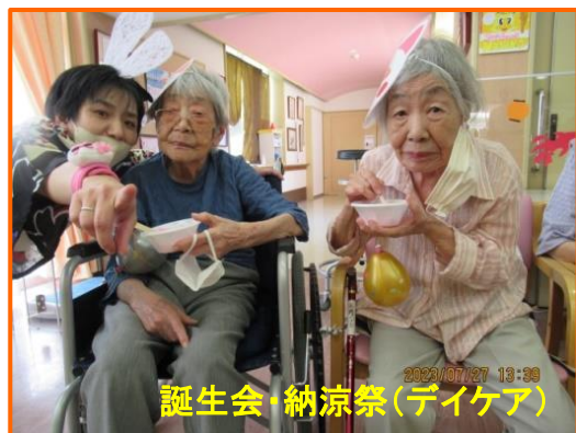
2023/07/27 13:39 誕生会・納涼祭(デイケア)