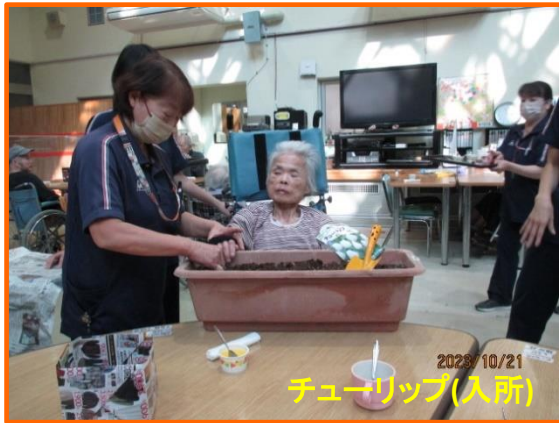
チューリップ(入所)