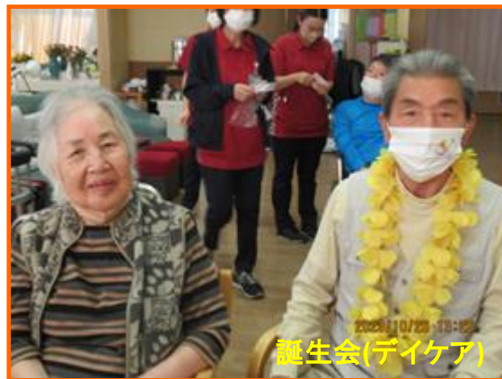
誕生日会(デイケア)

毎年、過ごしやすくなった秋の気配を感じながら、利用者様の同士の交流も図れるようにと、この時期にチューリップの球根を植えを行っています。皆様が1つ1つ大切に植えられた球根が、来年の春に可愛らしい花を咲かせるのを楽しみにしています。