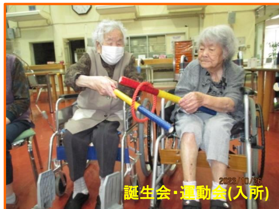
誕生日会・運動会(入所)

また、今月の誕生日者の中で、1名の方が100歳の誕生日を迎えられ、皆様から驚きの声と大きな拍手が送られていました。