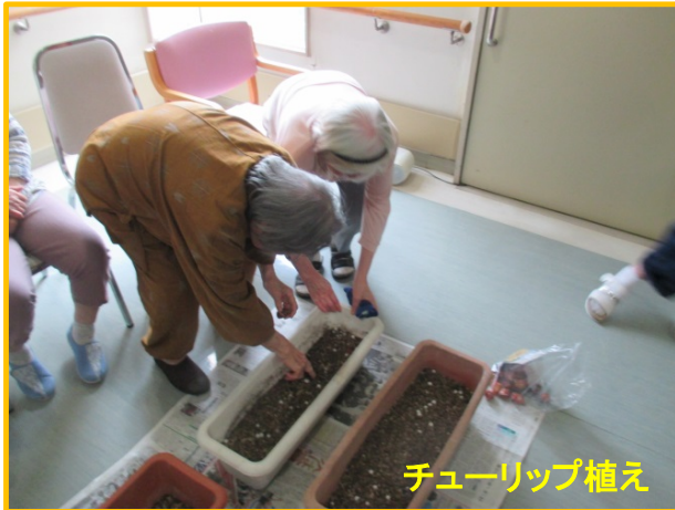
チューリップ植え