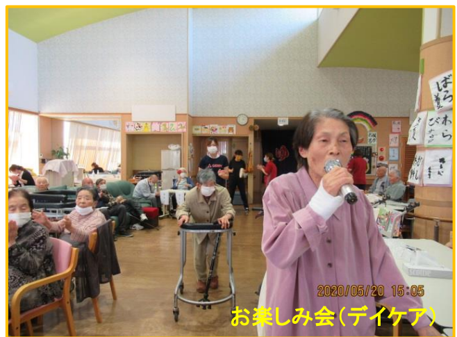
お楽しみ会(デイケア)