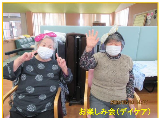
お楽しみ会(デイケア)