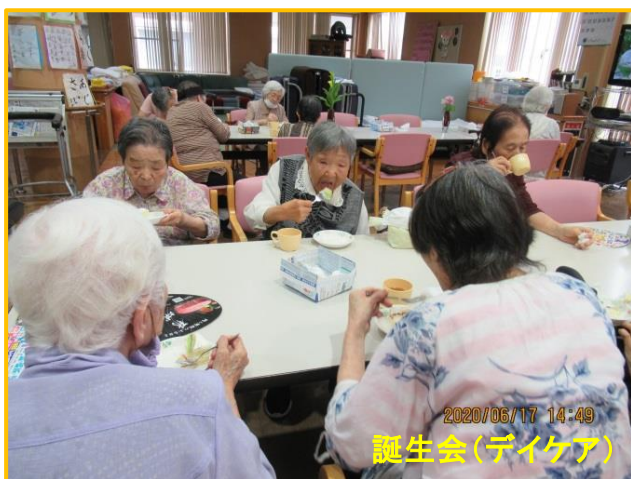
2020/06/17 14:49 誕生会(デイケア)