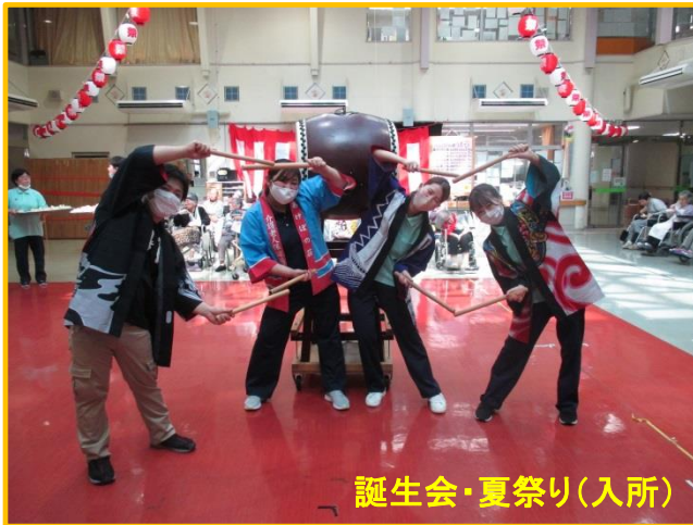
誕生会・夏祭り(入所)

一方、職員の箱にはタワシやコンニャク等が入っており、「ちょっと、痛いんやけど!」、「何かヌルヌルする!」といったリアクションを見せ、皆様の笑いを誘っていました。