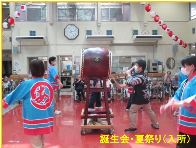
誕生会・夏祭り(入所)